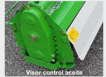
Visor control aceite