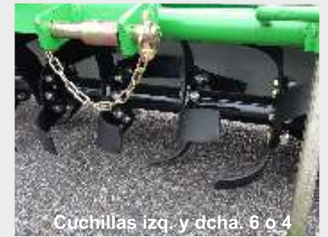
Cuchillas izq. y dcha. 6 o 4